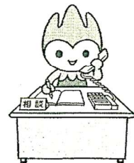
山口県PR本部長ちよるる

賃金、労働時間、退職、解雇、パワハラなど、労働問題に関するご相談に、専門の社会保険労務士がお応えします。