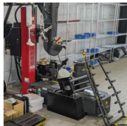
タイヤチェンジャー