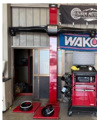
ホイールアライメントテスター