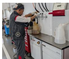
給廃油キャビネット