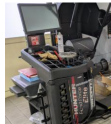
ホイールバルンサー