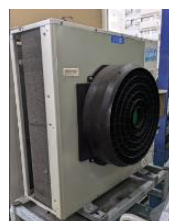
スポットバズーカ