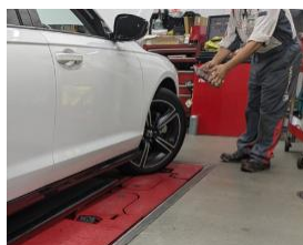
大型自動車整備対応パンタ式リフト