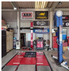
作業場の様子(設置場所)