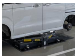
パンタグラフ式リフト