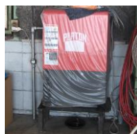
大型自動車整備用1柱リフト